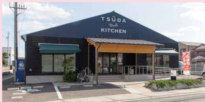
ユニバーサルカフェ「つだまちキッチン」

福祉業界のやり方は、なぜこんなにも外の世界とかけ離れているのだろう。それが、この業界に入っての率直な感想でした。誤解を恐れずに言えば、福祉の世界もイメージがとても大事で「楽しい」とか「かっこいい」という感情をもっと生み出せるような仕組みが必要だと思ったのです。2年ほど前に、徳島市内に「つだまちキッチン」をオープンしたのも「だれもが普通に暮らせる幸せを提供したい」という願いからでした。