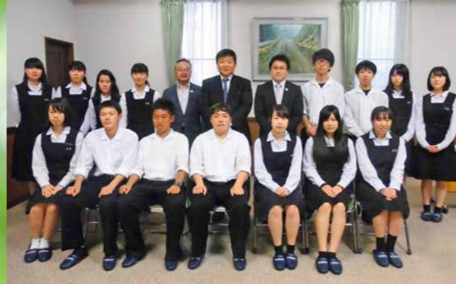
富岡西高校生との意見交換会に参加

地球温暖化対策の強化や、地域共生社会の構築、警察における相談体制の拡充など、9月議会では徳島の未来を見据えた質問を行いました。当日の内容をダイジェストでお伝えします。