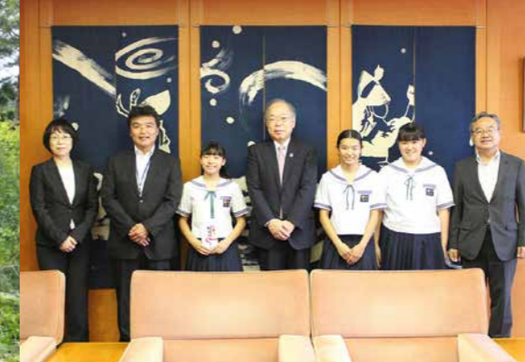
城東中学校吹奏楽部の副知事表敬訪問をセッティング