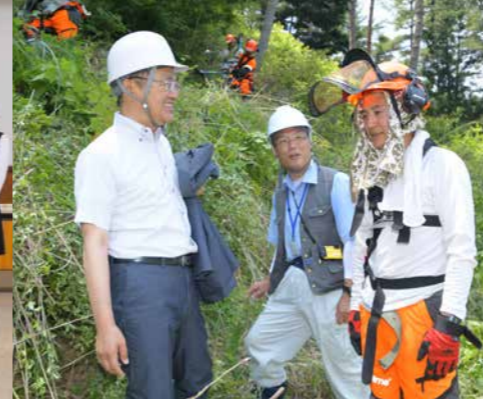
とくしま林業アカデミーの現場を視察